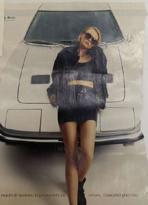
ronchi di motore, la primavera va veloce. Complici giacche.